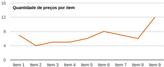
Quantidade de preços por item